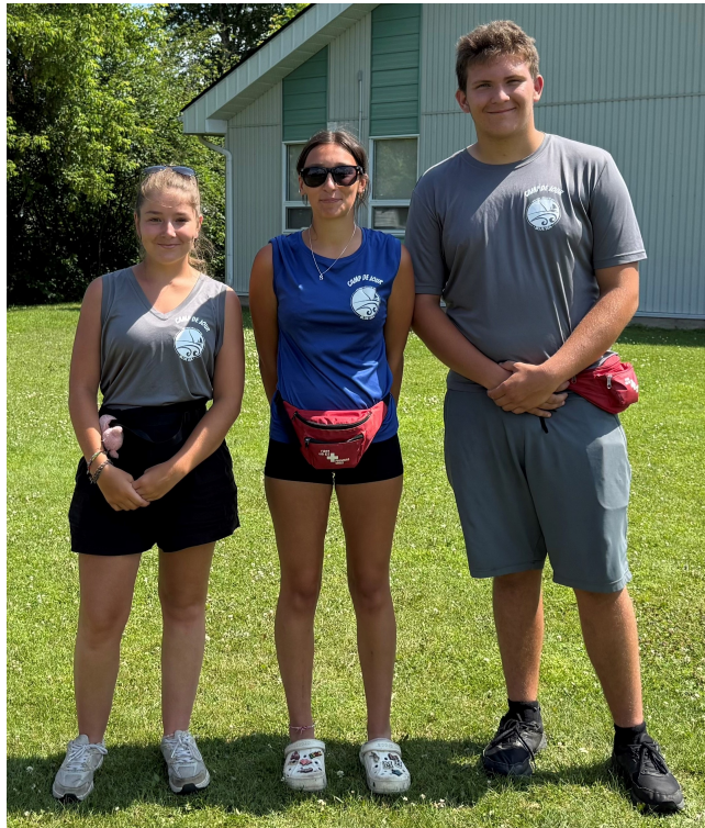
L'équipe 2026 – Kiwi, Mimi & Balou

En cas d'absence de votre enfant, vous devez en aviser le camp de jour en téléphonant au (819) 463-2261 #5 ou en écrivant à loisirs@blueseas.ca en vous assurant de mentionner le nom de l'enfant absent.